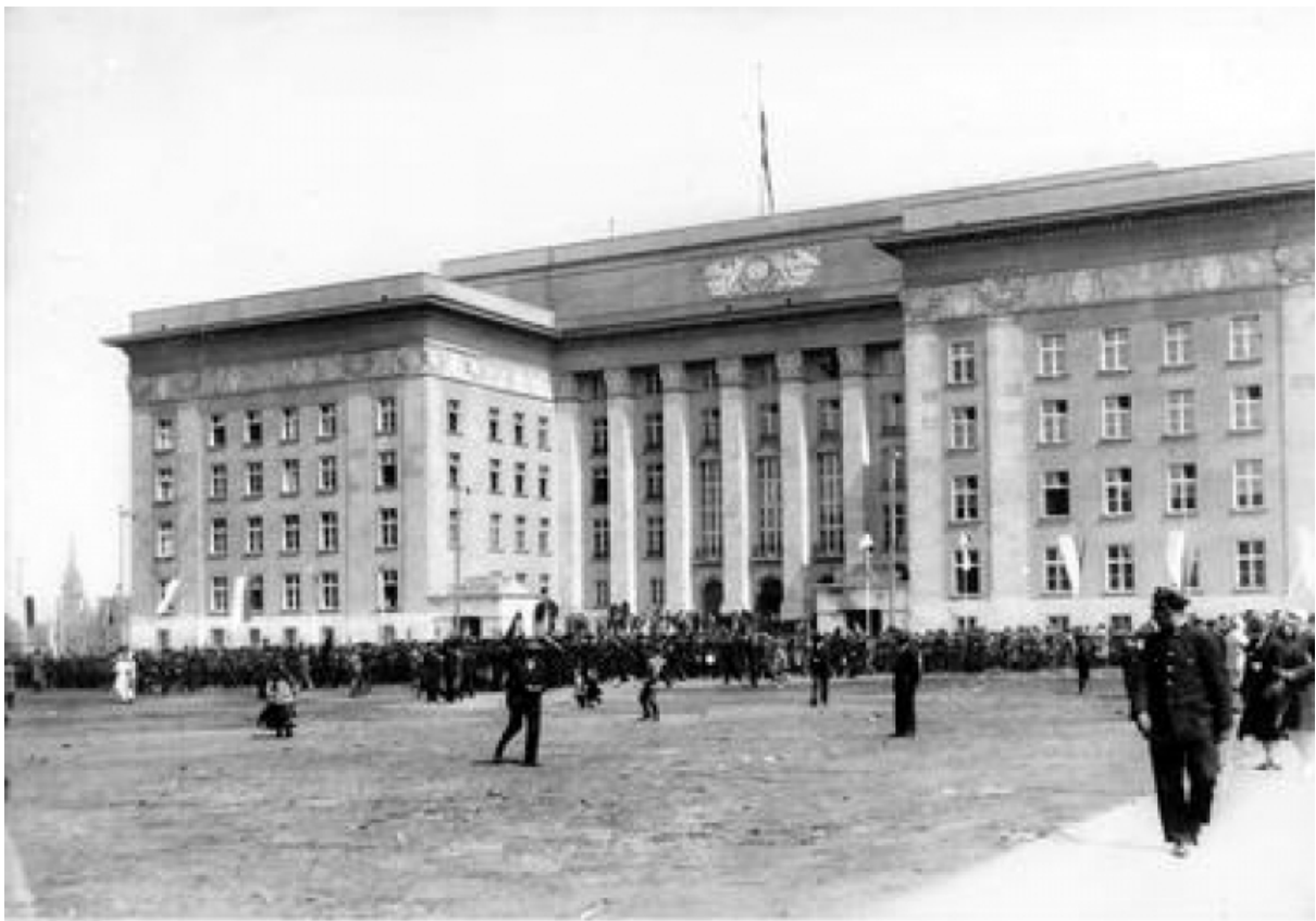
Siedziba Sejmu Śląskiego